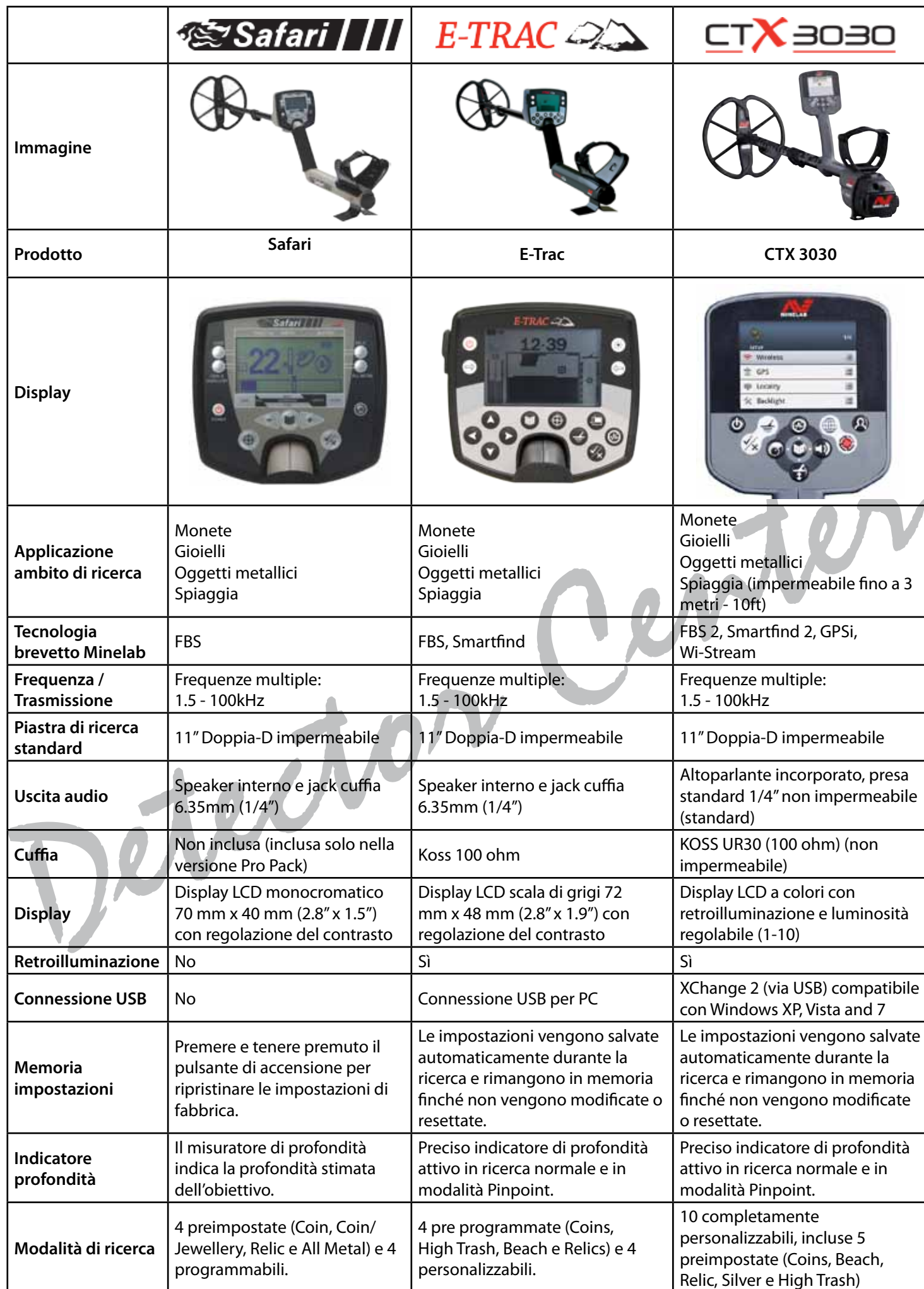
TABELLA DI CONFRONTO CARATTERISTICHE METAL DETECTOR MINELAB